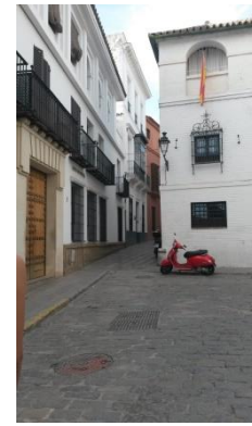
Ruelle du centre

4 ème semaine. Derniers cours, dernières sorties tous ensemble, dernières pauses où tout le monde se retrouve, et dernière soirée que nous avons passée dans un karaoké, puis en ville avec tout le groupe d'amis, les correspondants... Les adieux ont été compliqués et le samedi 28 octobre, retour à Lyon (et au froid) avec un niveau d'espagnol bien meilleur.