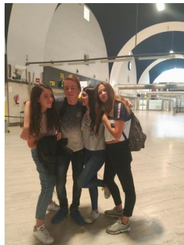
Les adieux à l'aéroport

4 ème semaine. Derniers cours, dernières sorties tous ensemble, dernières pauses où tout le monde se retrouve, et dernière soirée que nous avons passée dans un karaoké, puis en ville avec tout le groupe d'amis, les correspondants... Les adieux ont été compliqués et le samedi 28 octobre, retour à Lyon (et au froid) avec un niveau d'espagnol bien meilleur.