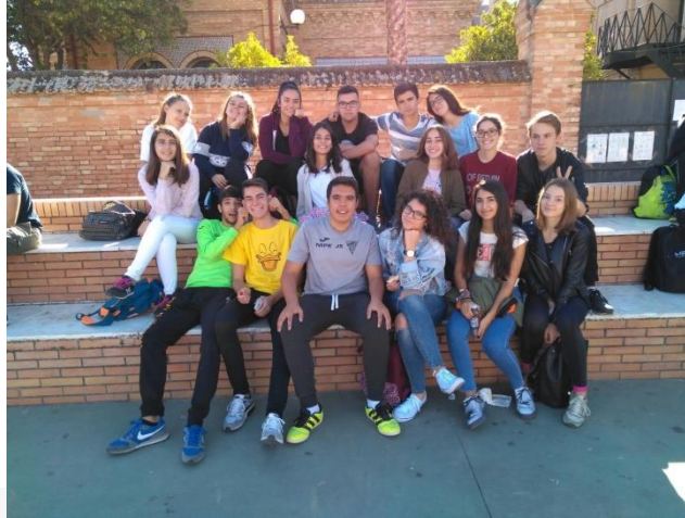
Amigos del instituto

En las clases, los alumnos tutean a sus profesores, hay más proximidad entre ellos que en Francia.