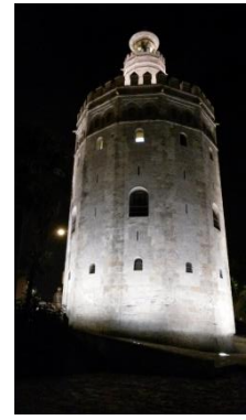
La Torre del Oro