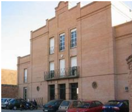
Fachada del Instituto