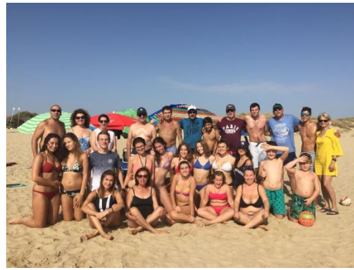
A la plage avec tous les correspondants et leurs familles