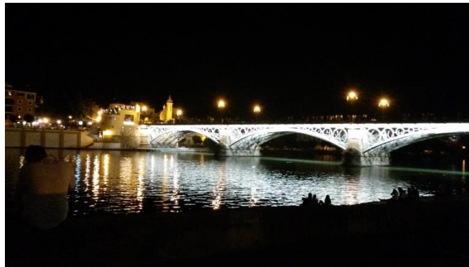
Pont de Triana, sur le Guadalquivir