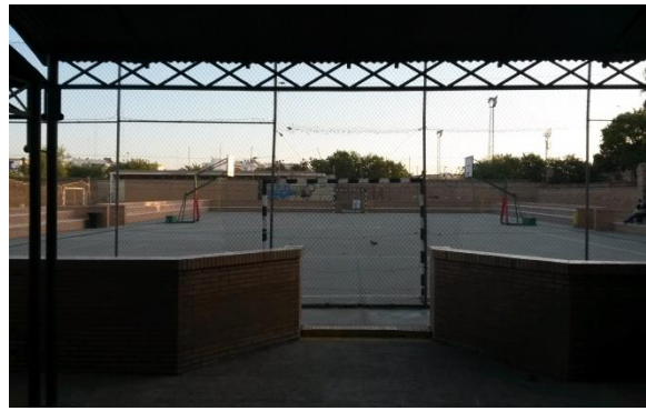
Terreno de deporte