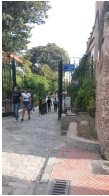
Jardins de Murillo