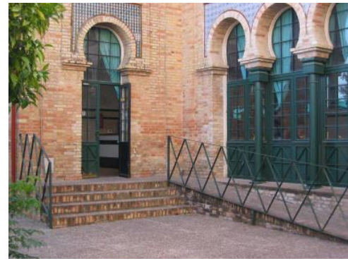
Entrada de la cafetería