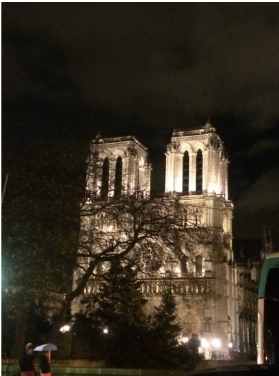
La cathédrale de Notre Dame illuminée de nuit depuis le bateau mouche

Après avoir visité le Palais de la Découverte nous avons eu la chance de pouvoir prendre un bateau mouche au pied de la Tour Eiffel. Lors de notre balade nous avons vu de nombreux bâtiments emblématiques de Paris sous le coucher de soleil comme l'ancienne gare d'Orsay, la cathédrale de Notre Dame de Paris et le pont Alexandre premier . Ce fut une agréable balade sur la Seine malgré le froid Parisien. Nous avons pu avec joie saluer quelques promeneurs.