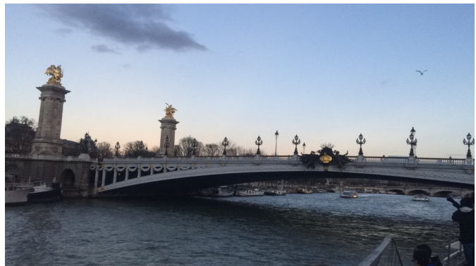
Le pont Alexandre premier depuis le bateau